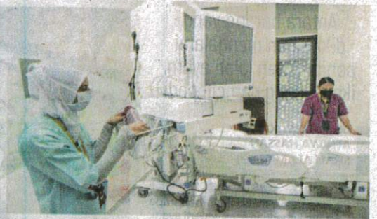
Ketiadaan pengawalseliaan untuk Pentadbir Pihak Ketiga (TPA) akan meningkatkan kos penjagaan kesihatan. - Gambar hiasan

Dr Azizan turut menyatakan isu lain seperti yuran pendaftaran yang tinggi sehingga RM5,000 hanya untuk disenaraikan sebagai klinik panel, pembayaran tertunda dan penolakan tuntutan, ketidakcekapan operasi, tidak telus dan isu penetapan