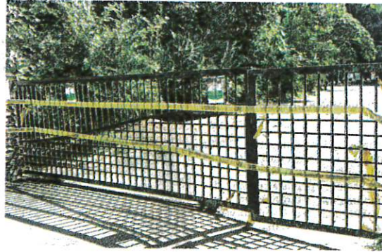
PINTU pagar ke Taman Eko Rimba Lata Bayu telah ditutup di Baling sejak beberapa hari lalu.

AKHBAR : KOSMO MUKA SURAT : 16 RUANGAN : NEGARA