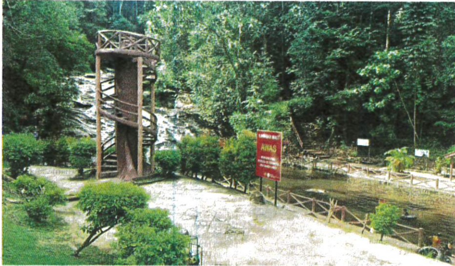
TAMAN Eko Rimba Lata Bayu di Baling ditutup sementara selepas dua pengunjung disyaki dijangkiti penyakit kencing tikus selepas berkunjung ke pusat peranginan itu.

AKHBAR : HARIAN METRO MUKA SURAT : 6 RUANGAN : LOKAL